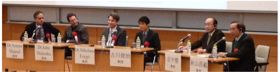
クリニカルデータ国際シンポジウム パネルディスカッションの様子 (3/5開催)

平成13年12月26日に保健医療分野の情報化にむけてのグランドデザインが策定されてから、医療機関における情報化は進み、多くの診療情報が電子保存されました。そこで、すでに蓄積されているクリニカルデータを活用することで、医療の質の向上、医療